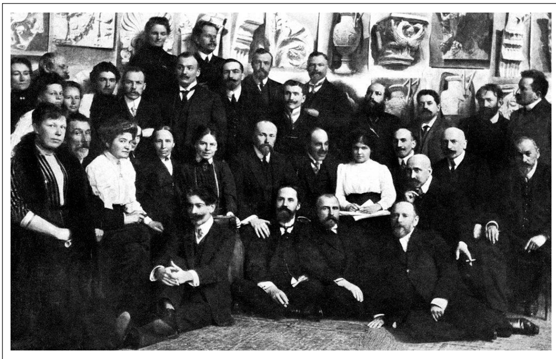
Педагогический совет Школы. 1911 г.

В заключение могу сообщить, что для увеличения помещения Школы архитекторами А.И. Фон-Гогеном и Б.К. Рерихом выполнен проект надстройки верхнего этажа (в размере пяти классов) и в текущем году Комитетом Общества предположено изыскать средства на выполнение означенного расширения Школы, которое должно стоить 85.000 рублей и может ознаменовать 75-ти летний юбилей Школы, наступающий 31 октября 1914 г.